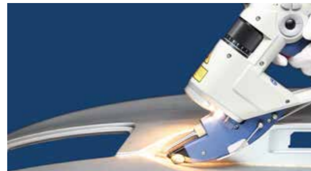
Handgeführter Laser: Der Laser kann nur betätigt werden, wenn das Handteil Kontakt zum Werkstück detektiert.

Die „Bayerischen Laserschutztag“ befassen sich mit der aktuellen Gesetzeslage und damit den Pflichten von Herstellern und Betreibern. Sie gehen auf den Stand der Lasersicherheitstechnik ein und informieren über neue Forschungsaktivitäten und Entwicklungen rund um die Lasersicherheit. Außerdem stehen die Themen persönliche Schutzausrüstung und Laser-bedingte Augenverletzungen auf der Programm der diesjährigen Tagung.