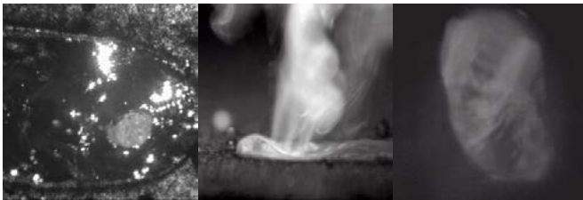
Kamerabasierte Prozessbeobachtung beim Laserstrahl-tiefschweißen: Schmelzbad – Dampfackel – Dampfkapillare; Quelle: Felix Tenner / LPT

Das Bayerische Laserzentrum und bayern photonics richten nun in diesem fünften Photonikseminar den Fokus auf die kamera-basierte Prozessüberwachung. Dabei werden ein tiefer Einblick in die neuesten Entwicklungen bei den Herstellern entsprechender Systeme gewährt und die aktuelle Forschung in den Laboren der Institute aufgezeigt. Darüber hinaus wird auf die Schnittstellen, Objektive und die Bildauswertung eingegangen.